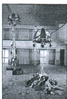
Lucy & Jorge Orta "Antarctic village"

sempre più grande dal punto di vista geografico ed economico. Negli ultimi decenni gli artisti hanno avuto difficoltà a trovare una posizione nelle gallerie e nel sistema del mercato, oggi invece i giovani artisti emergono, la nuova generazione di artisti italiani potrà imporsi nel panorama internazionale, principio che vale per tutte le latitudini».